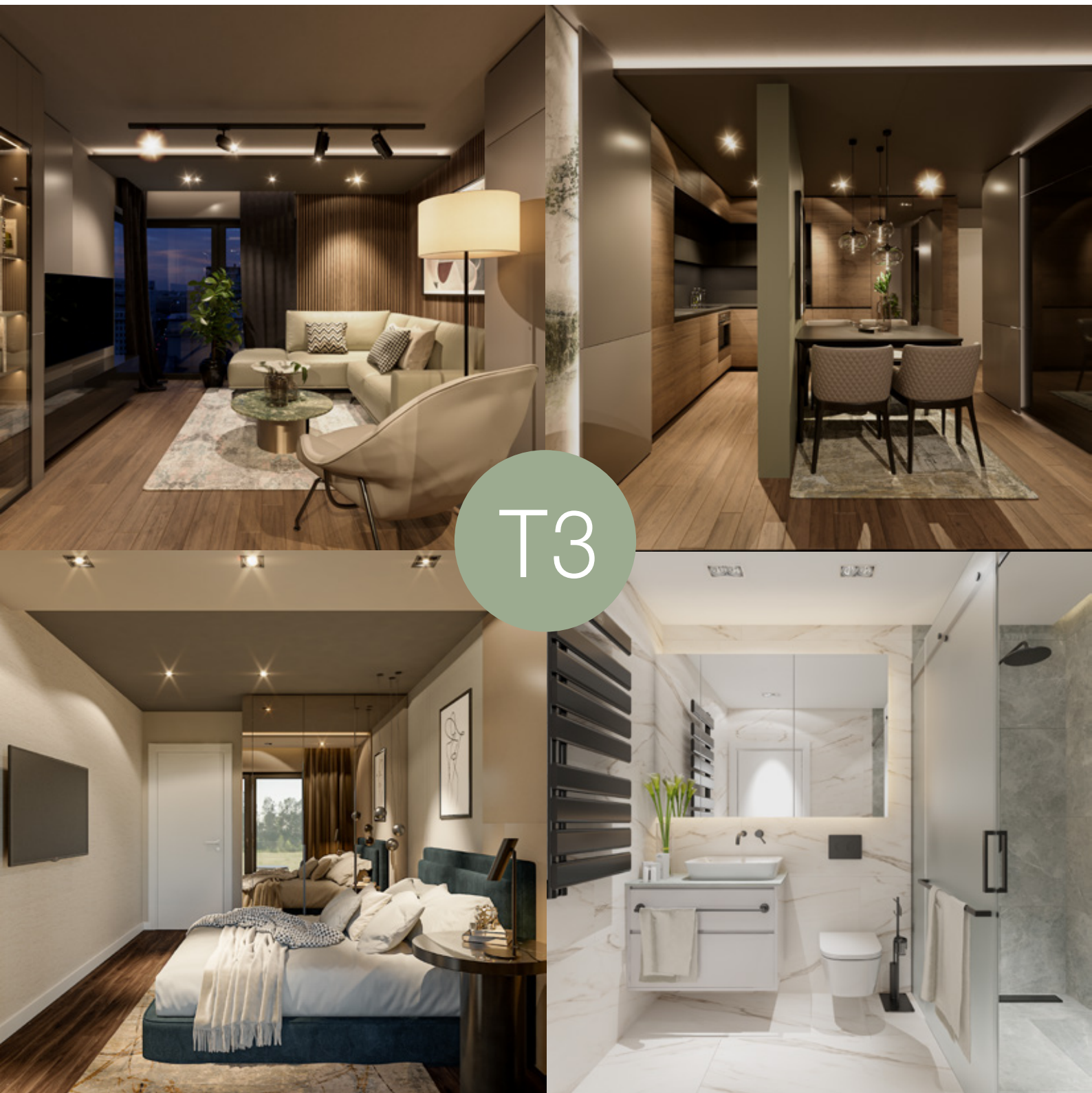
3D prikaz predloga uređenog stana