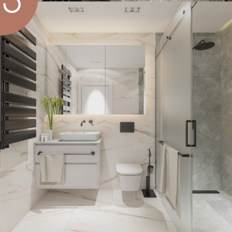
3D prikaz predloga uređenog stana