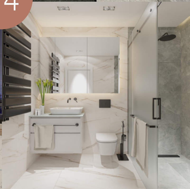
3D prikaz predloga uređenog stana